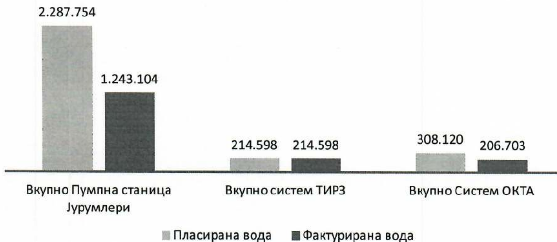
График 3: Вкупно пласирана и фактурирана вода прикажано по системи (m 3 )

Во моментот ЈКП "Водовод" н.Илинден врши експлоатација на вода од три водоводни системи, систем Јурумлери, систем ОКТА и систем ТИРЗ. Од водоводниот систем Јурумлери со вода се снабдуваат населените места Илинден, Марино, Кадино, Мралино, Ајватовци, Бунарџик, Бучинци од општина Илинден, Гоце Делчев, Јурумлери, м.в. Дрма и Идризово од општина Гази Баба како и населените места Петровец, Огњанци, Р'жаничино и Ќојлија од општина Петровец. Од водоводниот